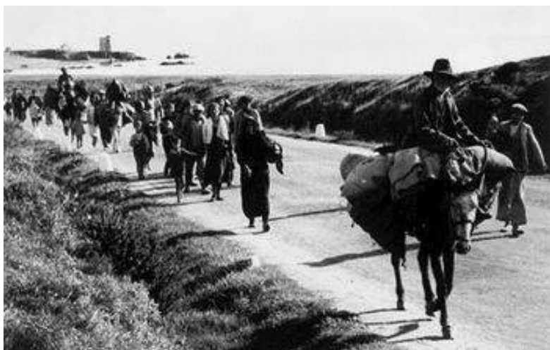
Caída Málaga en poder de las tropas de Franco el 8 de febrero de 1937, una multitud de familias malagueñas abandona la ciudad, abarrotando la carretera que va hacia Almería. A lo largo de la caminata. A esta forzada huida se le conoce popularmente por la “Desbandá”.